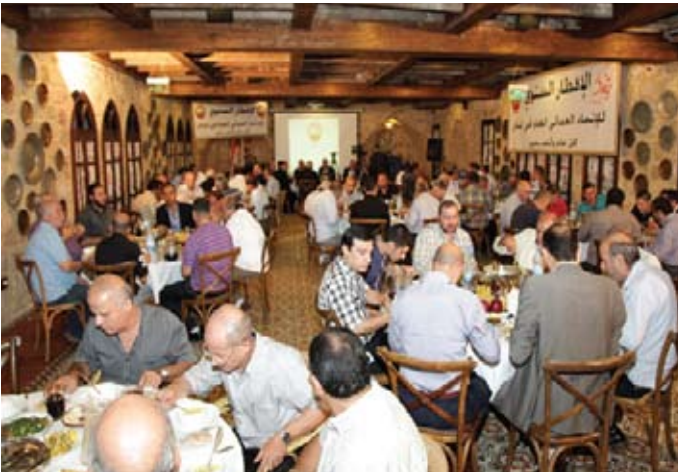
افطار الاتحاد العمالي العام في لبنان