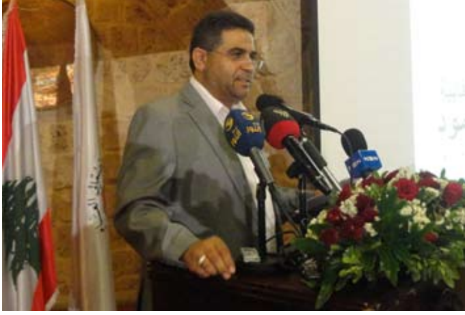
ياسين: المقاومة منتصرة بشعبها وحقها

انتصار مستمر يدفع العدو كل يوم ثمنا جديدا له من حساب غطرسته التي كانت، ومن حساب مشاريعه التوسعية التي كانت، ومن حساب منظومة الوهن التي عمل طويلا على تشكيلها في مجتمعاتنا العربية وهي اليوم في خيبر كان، انتصار مستمر يسقط العدو الاسرائيلي واذنابه ومريده وداعميه ومتبنيه كل يوم في الخزي والعار الذي اسقطهم فيه في اليوم الذي فرضت المقاومة عليه اعلان الفشل في تحقيق اهدافه من عدوان تموز، وراح يبحث عن مخرج تقيه المزيد من السقوط الميداني والخسائر البنيوية التي يتعرض لها في مجتمعه والعالم هو أيضا انتصار مستمر في عقل المنتصرين مقاومة وجمهورا، ومنهم النقابيون اللبنانيون والعرب، الذين ما تركوا ساحة المقاومة، وما استكانوا عنها يوما، حضروا في ساحات معاركها، الأمامية والخلفية، رفعوا لها الرايات، نصروها وانتصروا لها وبها في كل محفل، وما زلنا نشاهد في المحافل نقابيين لبنانيين ونقابيين عربا، يحملون السلاح الذي دربوا عليه، سلاح الموقف والكلمة، يقولون قول الحق ويشهدون به، وما هم اليوم يرددون مواقفهم الشريفة المواكبة للمقاومة وفعالها وخيارها منذ انطلاقتها، يعلنون الموقف الراض والادانة الشاجبة للقرار الصهيوني باللسان والقلم الاوروبي، النقابيون اللبنانيون يرفضون هذا العدوان الاوروبي على لبنان وكرامة لبنان.