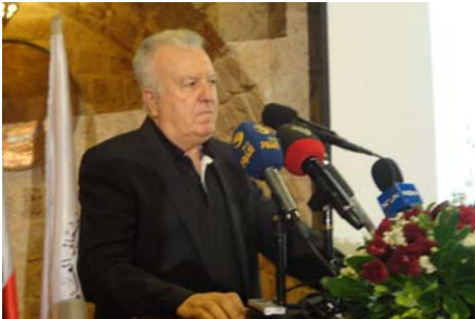
نجدة : ستبقى المقاومة شوكة في عيون اعدائها

وتطرق الى وضع ما سمي الجناح العسكري لحزب الله على لائحة الإرهاب، وكيف أن مقاومة حزب الله قضت مضاجعهم، فهذه المقاومة التي كانت وستبقى مواجهة للعدو الإسرائيلي وعملاؤه ستبقى شوكة في