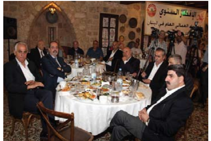
رؤساء الاتحادات في الاتحاد العمالي العام في لبنان

يقدم جائزة ترضية للعدو الإسرائيلي فيضع «المقاومة على لائحة الإرهاب تحت مسمى الجناح العسكري لحزب الله قافراً فوق ميثاق الأمم المتحدة و الحق الطبيعي للدول أفراداً وجماعات في الدفاع عن نفسها ومقاومة الاحتلال».