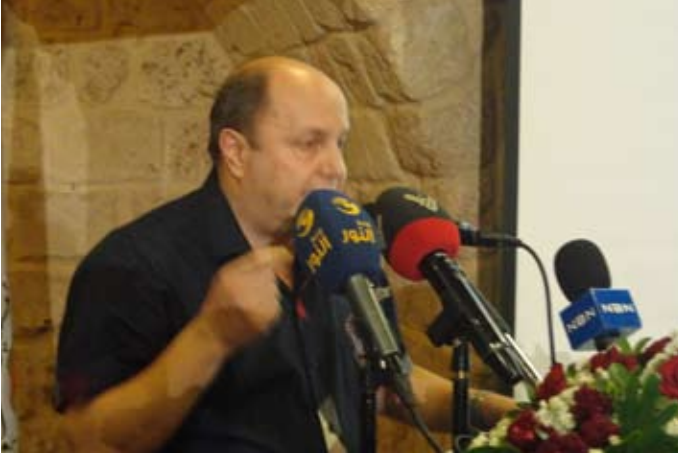
الأسمر: بنصر الله الى سوّدد الى مجد

لعقود وعقود وعقود ويحل الجحيم ونضرع ونصلي ونسأل يا الله افلا نهاية لليل المدلهم البهيم عتاه هيكل مغارة لصوص، مشارف ازابل واحاب وايشالوم يدكها الناصري، العهد الجديد الرحيم وبعد وبعد وبعد ترسل حزبك تنبت الكرامة والسعادة والامان وجيش الفسق متقهقر مسكون لئيم الله ينصركم وينصر الله الى سوّدد الى مجد.. الى طريق سليم قويم