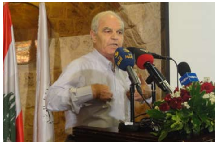
شريف: القرار الاوروبي عنصرية استعمارية

ولفت شريف الى أن "هناك حكام حكمت باسم قضية فلسطين فكيف تسكت على من يأتي ويفاجئهم ويكذبهم تجاه اسراييل، وقدم الدم وحقق الانتصار"، واعتبر شريف أن "القرار الاوروبي محاولة لتطويق هذه المقاومة والتعدي على كرامتنا، وله خلفية عنصرية، تأتي من تاريخ استعماري طويل مارسته كبريات الدول الاوروبية بحق الشعوب العربية"، وقال: "ماذا ينتظر منا الاوروبيون ونحن مواطنون عشنا حقيقة المقاومة وحقيقة التاريخ، ورأى شريف أن هذا القرار سيرتد عليهم".